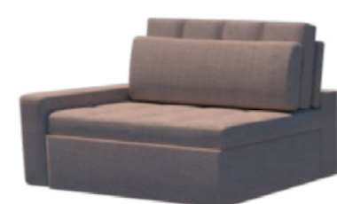
Módulo - S/br

Por ser um produto artesanal, poderão ocorrer variações nas medidas informadas. A Bell'Arte se reserva o direito de efetuar modificações no produto sem prévio aviso.