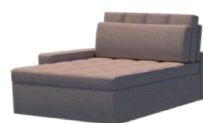
Módulo - Chaise