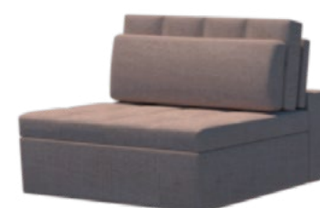
Módulo - S/br