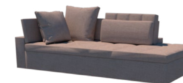
Módulo - Canto Puff

1 ass. 1,75 + puff 0,60 / 2,60 m *2 alm. 0,55 x 0,55 m + 1 alm. 0,70 x 0,70 m