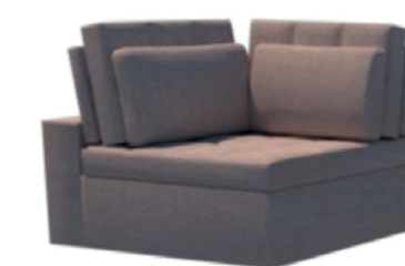
Módulo - Canto